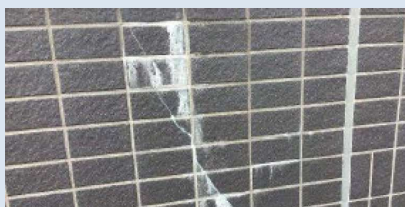
▲外壁タイル部ひび割れ・エフロレッセンス