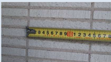
▲タイルの種類・サイズの確認