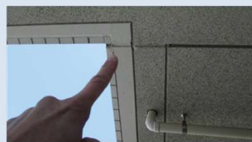
▲シーリングの有無・仕上げの確認